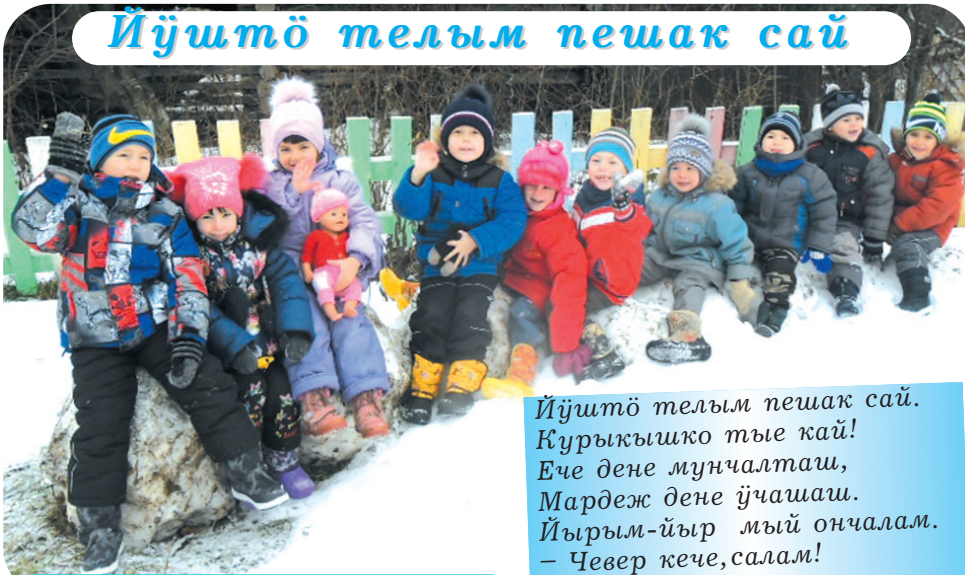
Волжский, Пётъял.

Йүштө телым пешак сай. Курыкышко тые кай! Ече дене мунчалташ, Мардеж дене йчашаш. Йырым-йыр мый ончалам. — Чевер кече, салам! Лумжо чинчын йылгыжеш. Курык гыч волаш йжеш.