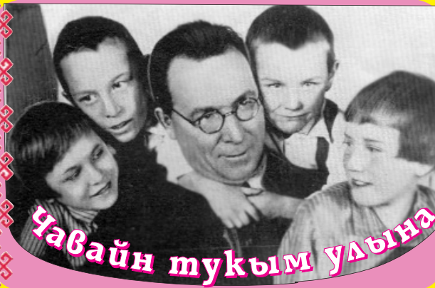
Чавайн тукум улдына