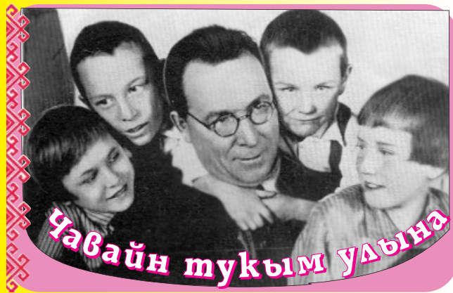
Чавайн тукум улына