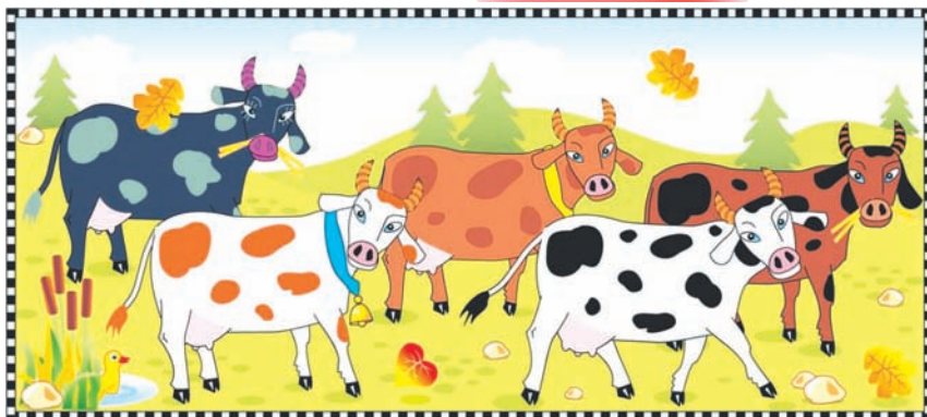
Кандаш ойыртемым му.