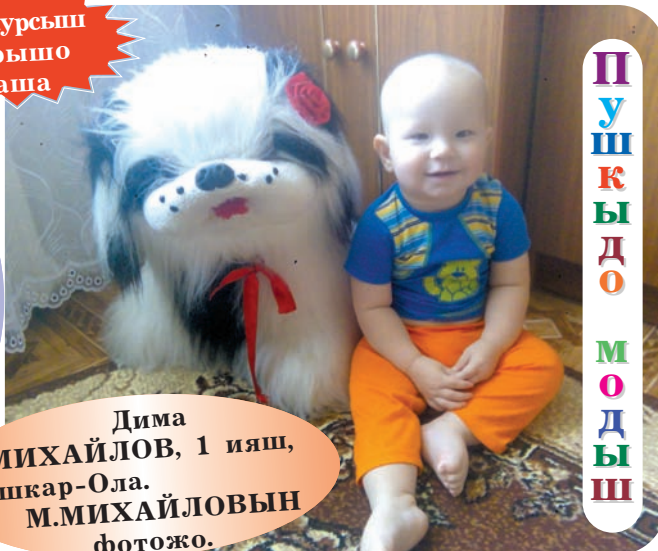
Дима МИХАЙЛОВ , 1 ияш, Йошкар-Ола.