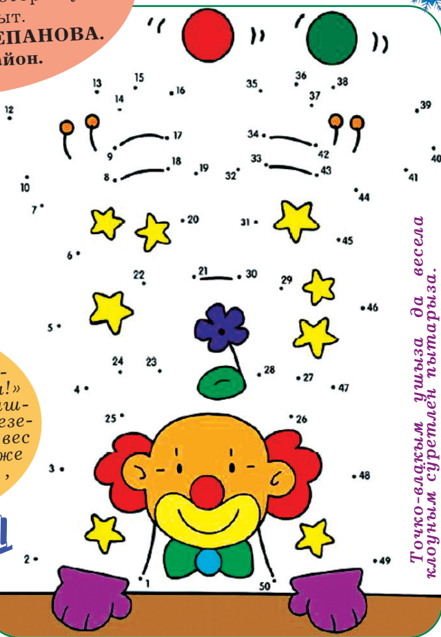
Токко-вактым ушыза да весела клоуным суретлен пытарыз.

✳ Вондерла, пушегыла кушмо верыште ида мунчалте.