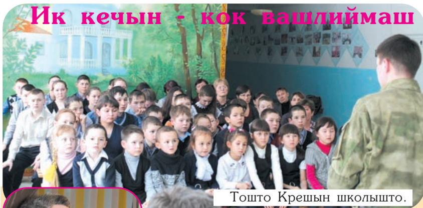
Тошто Крешын школышто.

Республикыштына оборонно-массовый да военно-патриотический паша месячник гочым Оршанке район Кугунур да Тошто Крешын школлаште вашлиймаш эртен.