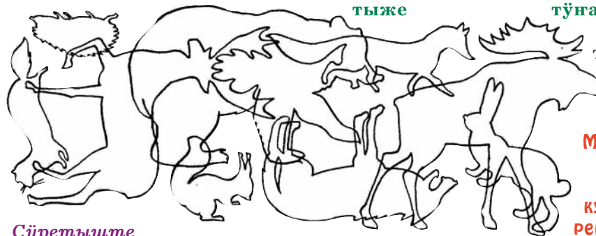
Сўретыште янлык-влакым муза. Нуным нерген мом паледа?

– Илыш ончыко кайыме дене пүртүс түняштат вашталтыш ятыр. Жапыштыже