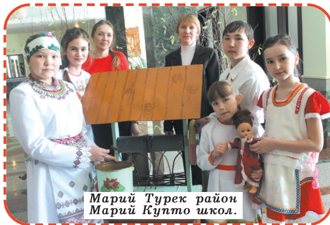
Марий Турек район Марий Купто школ.