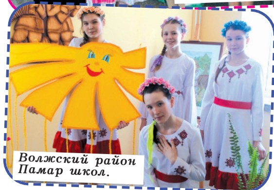
Волжский район Памар школ.