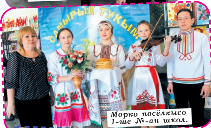
Морко посёлкысо 1-ше №-ан школ.