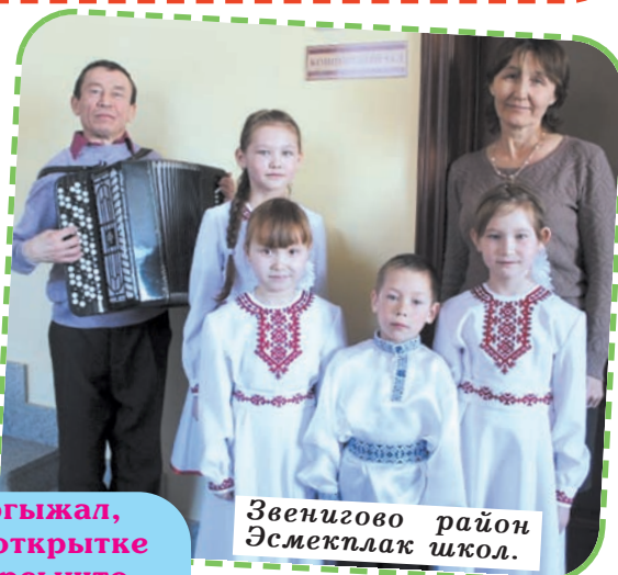
Звенигово район Эсмекплак школ.