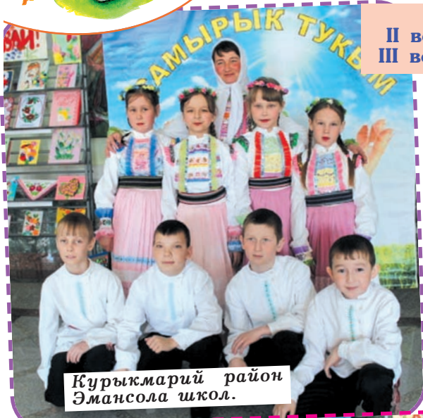
Курыкмарий район Эмансола школ.

I вер - Килемар район Арде кыдалаш школ. II вер - Советский район Ушнур кыдалаш школ. III вер - Йошкар-Оласе 14-ше номеран гимназий.