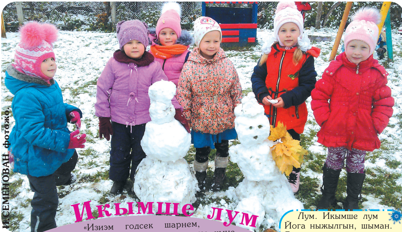
И. СЕМЕНОВАН фотожо.