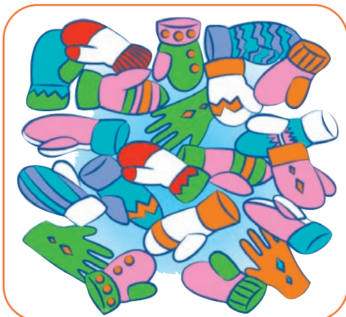
Пиж-влакым мужыр дене оптыза.

Фото-влакым vk.com/yamde_lii тўш-каш верандена. Сенгышым йўклымө почеш ойырен налына Эскерыза!