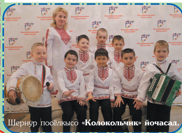
Шернур посёлкысе «Колокольчик» йочасад.

Ансамбль дене мурымаште Шернур посёлкысе «Колокольчик» йочасад «Эх, ну, Калтаса!» калык муро дене сенгышыш лектын. Кокымшо верыште Медведево районысе «Золотая рыбка» йочасад лийын. Советский район Шуарсола школ пеленысе йочасад кумшо верым сенен налын.