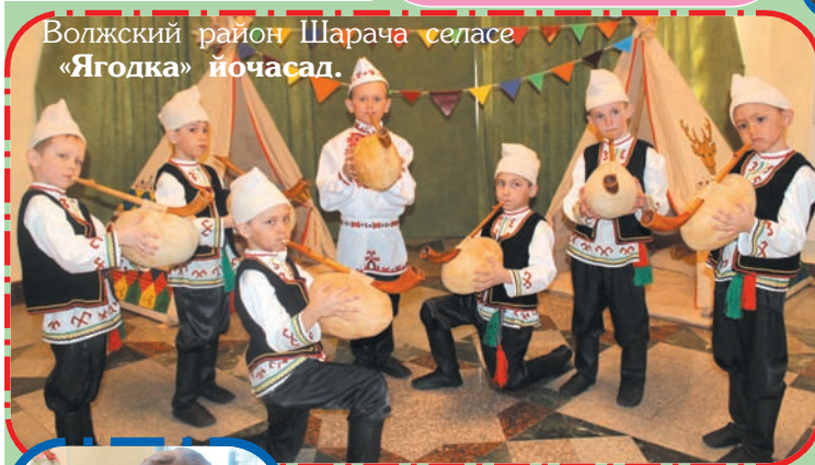
Волжский район Шарача селасе «Ягодка» йочасад.