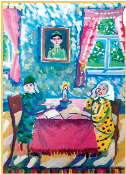
Соня ТАНИКОВА. Йошкар-Ола, Бауман лицей.