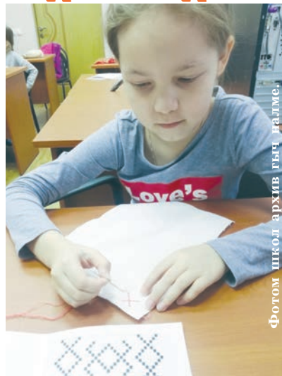
Фотом школ архив гыч галме.

Марий калыкын пўрымашыже – йоча-влакын кидыштышт. Оласе йоча-влаклан марла кутыраш неле. Озан оласе школлаште руш ден татар йылмылам тунемыт. Туге гынат марла кутыраш тыршат. Марий ден татар йылмылаште икгай шомак-влакым кычалыт. Тўрлымў деч посна марла кушташ, марий мурым мураш тунемыт.