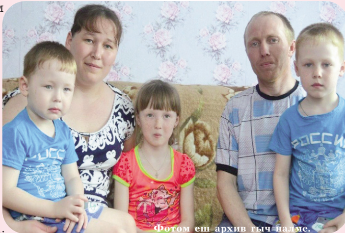
Фотом еш архив гыч налме.