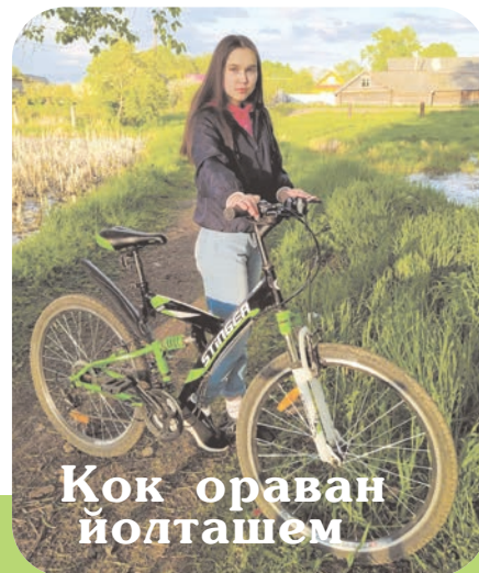
Кок ораван йолташем