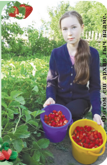
Фотом еш архив гыч налме.