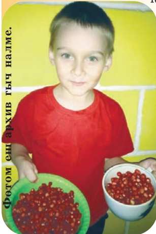
Фотом еш архив гыч налме.