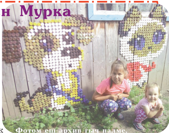
Фотом еш архив гыч налме.

Кужэнгер район Йывансола ялыште илена, суртысо пырдыжеш тыгай сўретым кельшта-рышна. Шоньмаш ондакак лийын. Тўрлө ате гыч петыртыш-влакым коккум ий погенна. Тений пашалан пижынна. Эн ондак