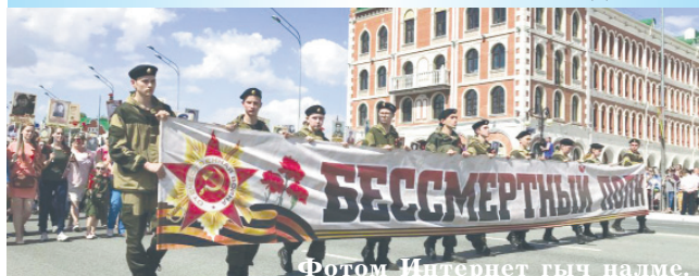
Фотом Интернет гыч налме.