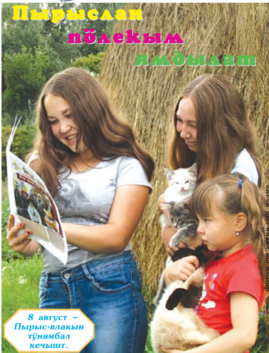
Фотом еш архив гын налме.

8 август – Пырыс-влакын тўнямбал кечышт.