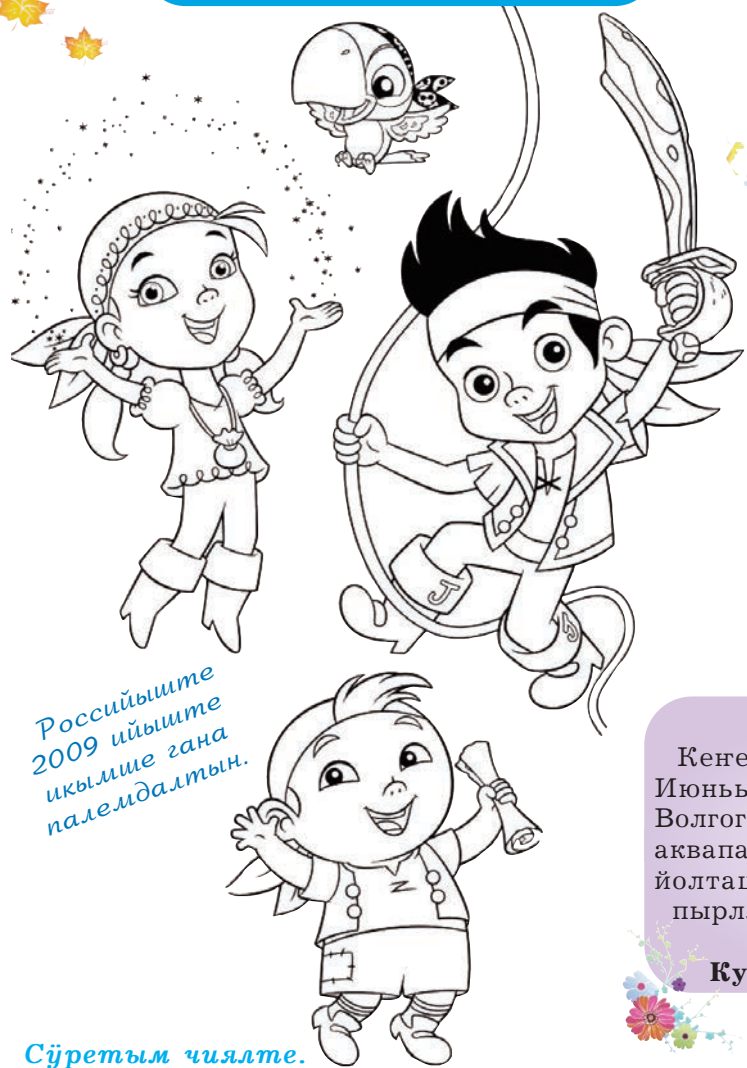
Российыште 2009 ийыште икымше гана палемдалтын.