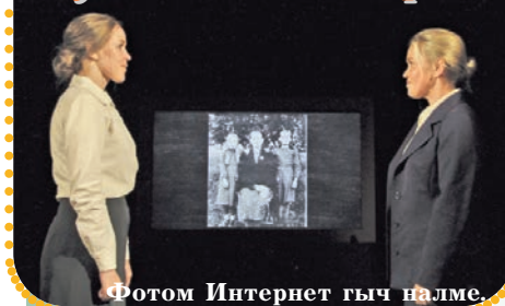
Фотом Интернет гыч налме.