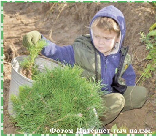
Фотом Интернет гыч налме.

Марий Эл «Сохраним лес-2020» всероссийский акцияш ушнен. Акцияш икымше участникше-влак Йошкар-Оласе Бауман лицейын 2-шо «Б» классыште тунемше ўдыр-рвезе-шамыч лийыныт. Икымше кечын кумылан-влак