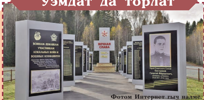
Фотом Интернет гыч налме.

Республикыште Кугу Ачамланде сарыште вуйыштым пыштыше, кредалше-влак да тылыште тыршыше-шамыч лүмеш тўрлö кундемыште шогалтыме памятник ден шарныктыш-влакым тўрлымö да уэмдыме паша шуйна. У Торъял район Кўанпамаш ялыште мемориал комплексым уэмден ачалыме ( снимкыште ). Шукерте огыл тудым торжественно почмо.