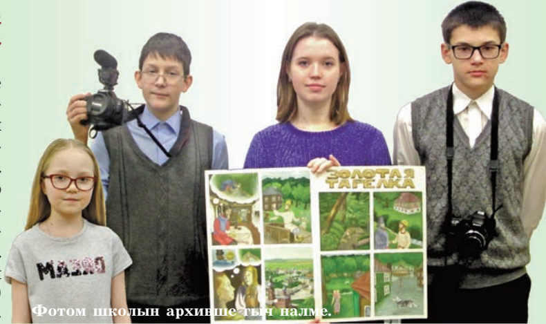
Фотом школын архивше-тын налме.

ная мозаика малых городов и сёл» грант-влак конкурсышто «Медведевское золото» проектан дене сенгышыш лектынна. Тиде проектлан көра марий йомак ден легенде-влакым лудаш, марий калык вургемым шымлаш тўнгальна, марий калык йўла, тўвыра дене палыме лийына. «Шöртнö талинга» легенде почеш эн ондак комиксым сүретленна. Тудо книга гай лектын. Югра гыч йолташем-влак финн-угор фестивалышке ушнаш ўжыныт. Конкурсын условийже почеш, финн-угор йылме тўшкаш пурышо йылме дене фильмым войзы-