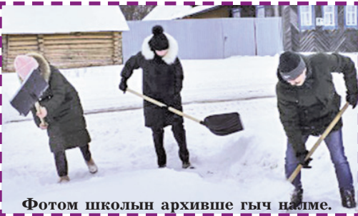
Фотом школын архивше гыч налме.