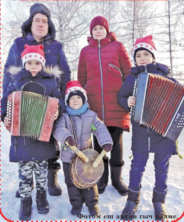
Фотом еш архив гыч палме.

Илья тений икымше гана парт коклашке шинчын. Шиялтыш дене шокташ тунемеш. Тудым Л.И.Данилова семүзгар дене палымым ышта.