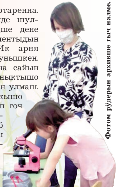
Фотом рўдерын архивше гыч налме.