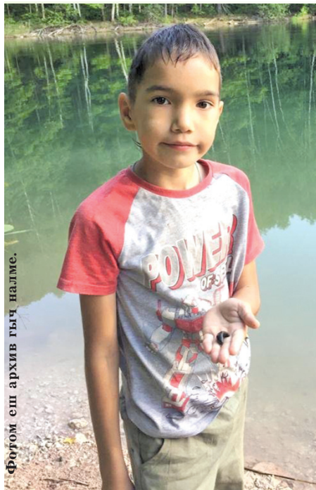
Фотог еш архив гыч налме.