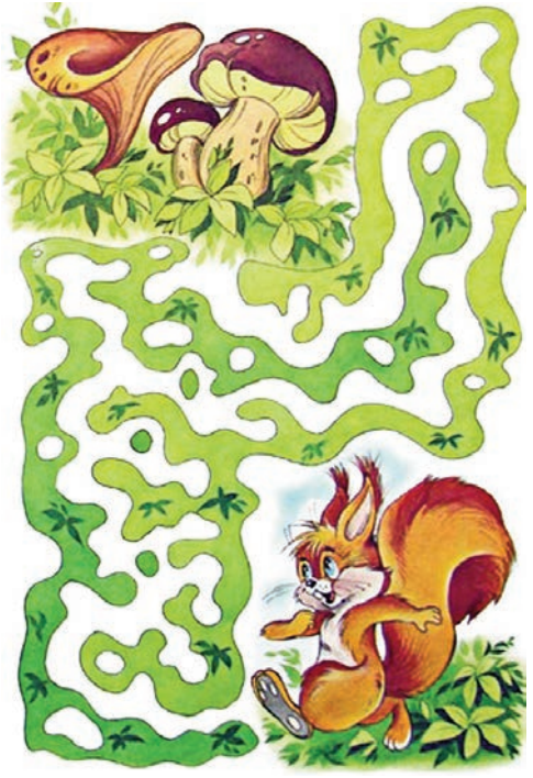
София ИСАЕВА. Волжск ола.

Ур тельлан понгым ямдылы- неже, но чодыраш йомын. Корным муаш полшыза.