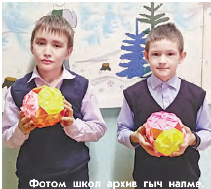
Фотом школ архив гыч налме.

Ме У ийым изин-кугун вучена. Тидлан сайын тунемына, түрлө конкурсышко ушнена да сeгышыш лектына. Пайрем вашеш классым сōрастаренна, У ий кожыш сакалаш модышым ямдыленна. Ончалза, могай мотор улыт!