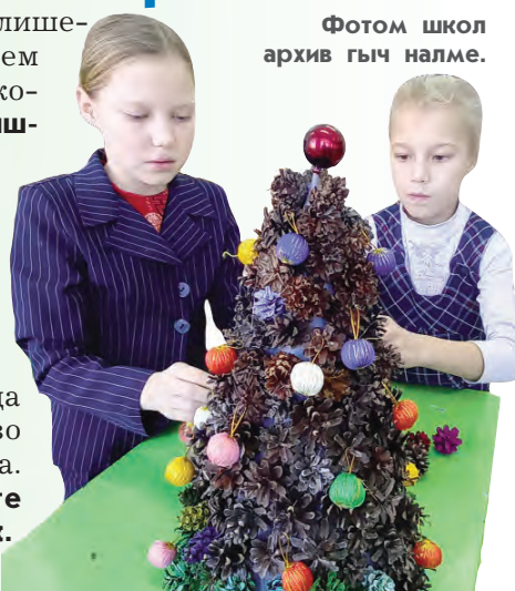
Фотом школ архив гыч Налме.