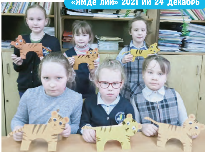
«Ямде лий» 2021 ий 24 декабрь