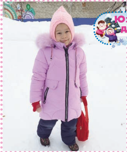
Юзо теле да мый