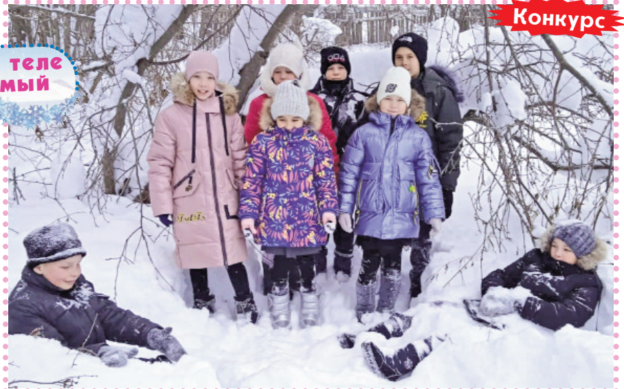
Кужэnger район Йывансола школын 3-4-ше класслаштыже тунемше-влак.