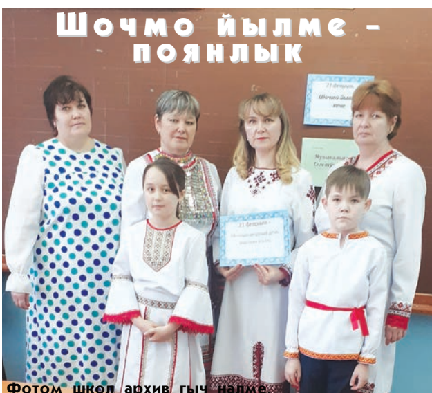
Фотом школ архив гыч налме.

1799 ий 3 мартыште Федор Ушаковын вуйла- тыме руш эскадр Средиземный теҥызысе Корфу орым сенен налын.