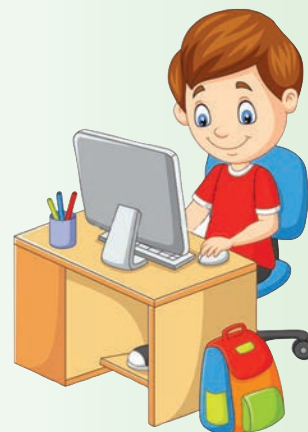
Сўретым Интернет гыч налме.