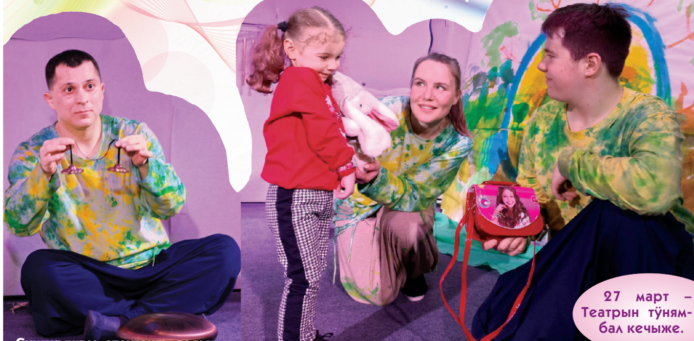
Снимкыште: спектакль годым.