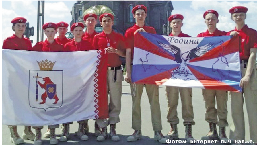
Фотом интернет гыч налме.

1-9 июльышто Моско кундем-мысе Алабино полигоньшто «Победа» всероссийский военно-спортивный модмашын финалже эртаралтын. Российын 84 регионжо гыч 14-17 ияш 1000 наре самырык ен чумырген. Ёдыр-рвезе-влак строй дене коштмаште, викториныште, «Визитка команды» конкурсышто, «Огневой рубеж» эста-