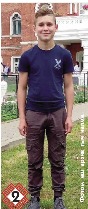
Фотом еш архив гыч налме.

1572 ий 2 августышто Михаил Воротинский ден Дмитрий Хворостинин вуйлатыме руш войска Молоди села воктене татар войскам кырен шалатен.