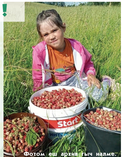
Фотом еш архив гыч налме.