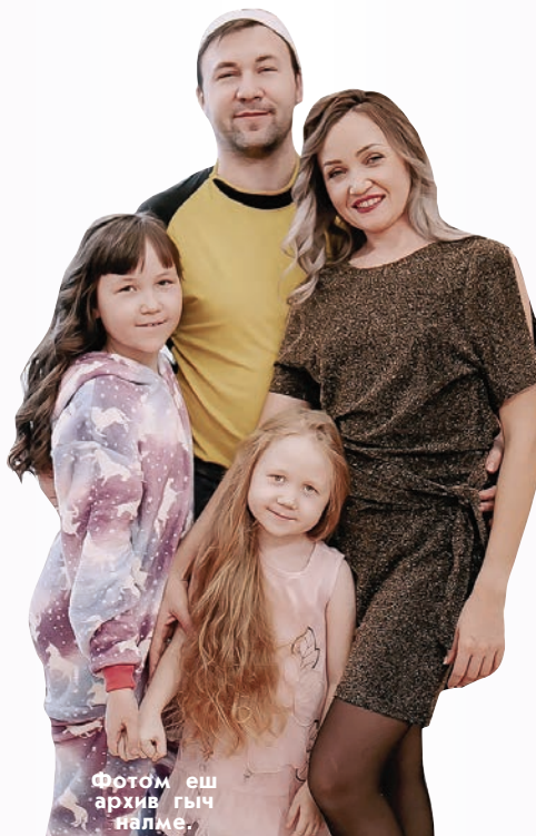
Фотом еш архив гыч алме.

новналан мўйым ужалаш полша. Камила марий улмыж дене кугешна. Школышто марла эртаралтше мероприятиялаш марий вургем дене коштеш. Марла мураш, почеламутым лудаш йьората. Яра