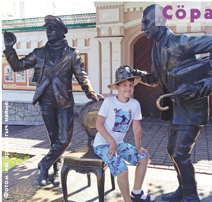
Фотом еш эр гыч налме.