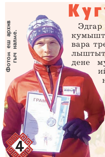
Фотом еш архив гыч налме.