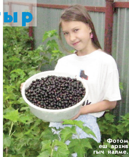
Фотом еш архив гыч налме.

Чодыра үмбалне тўтыра шога – понго лектеш.