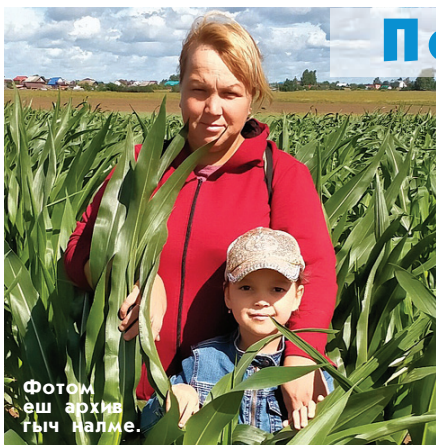
Фотом еш архив гыч налме.

Пушкыдеммешкыже, духовкышто 30-40 минут кўктыза. Ямде олмаш үмбалым йыген кочса. Тутло. Перкан лийже!