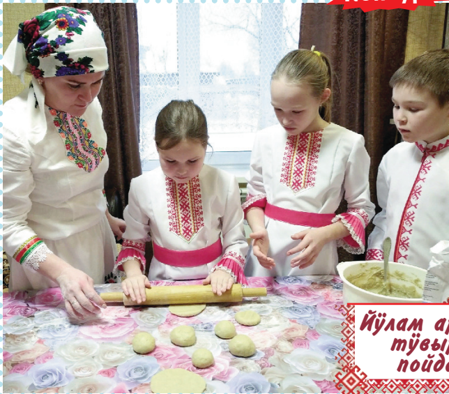
Йўлам арале – тўвырам пойдаре