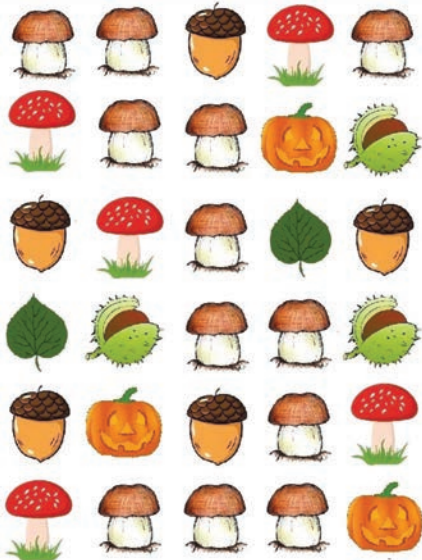
Понгым поген, лабирин- тым эртыза.