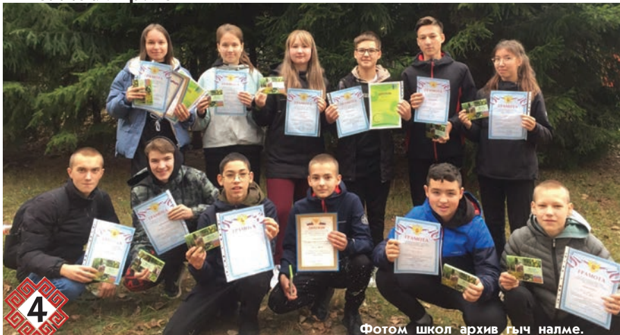
Фотом школ архив гыч налме.