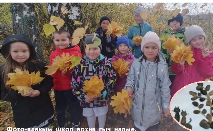
Фото-влакым школ архив гыч налме.