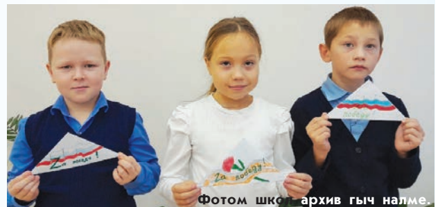
Фотом школ архив гыч налме.

Школыштына кажне шочмын «Разговоры о важном» класс шагат лиеш. «Патырлык урокышто» Кугу Ачамланде, Афган, Чечня сар-влак, Украиныште эртаралтыше спецопераций нерген мутланенна. Шуко салтакын подвигше нерген пален налынна. Урок мучаште салтаклан серышым возенна (снимкыште) . Тек тўнямбалне тыныс илыш лиеш. Рвезе-влак таза пўртылышт.