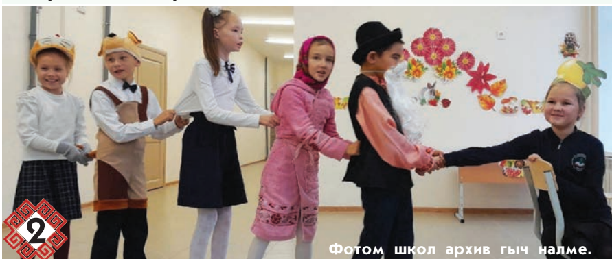
Фотом школ архив гыч налме.