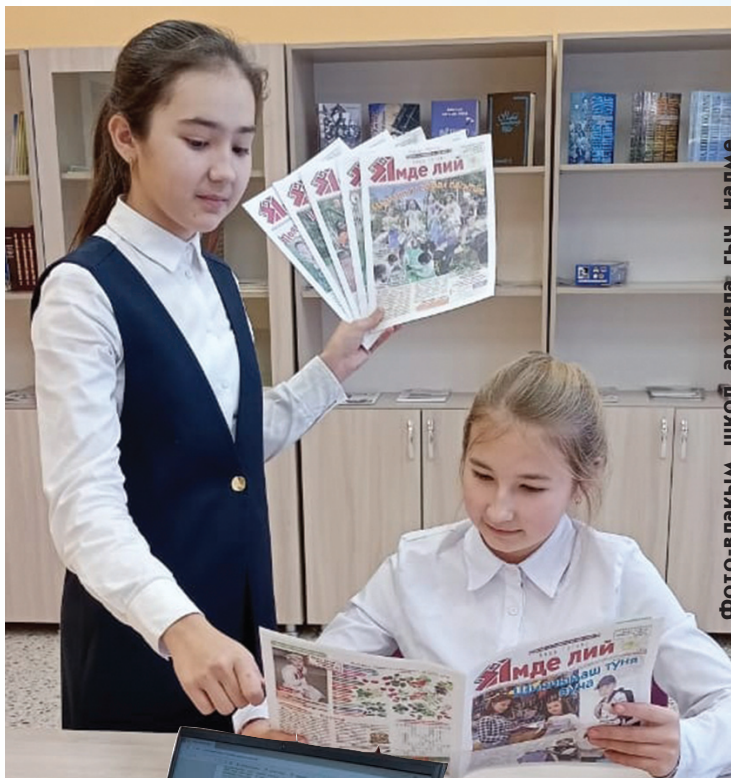
фото-влакым школ архивла гыч налме.