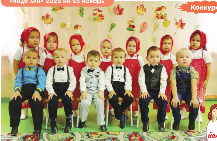
«Гномики» группыш кошшо йоча-влак. Звенигово, Кужмарий.