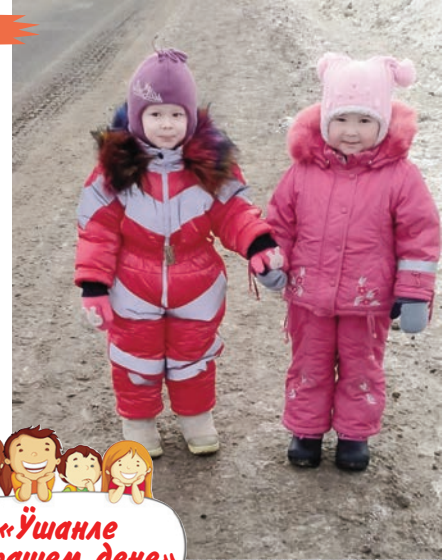
«Ушанле йолташем дене»