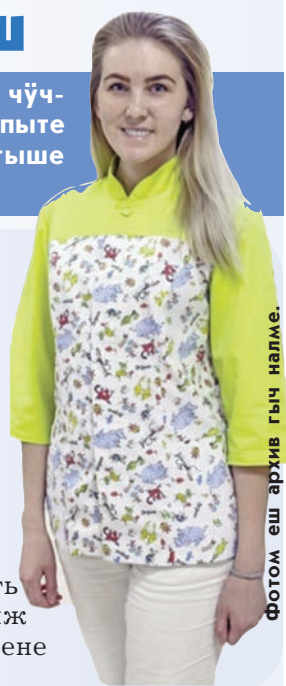
фотом еш архив гыч налме.