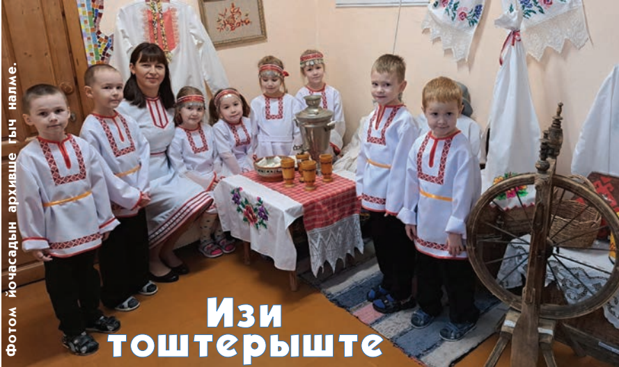
Фотом йочасадын архивше гыч нөлме.