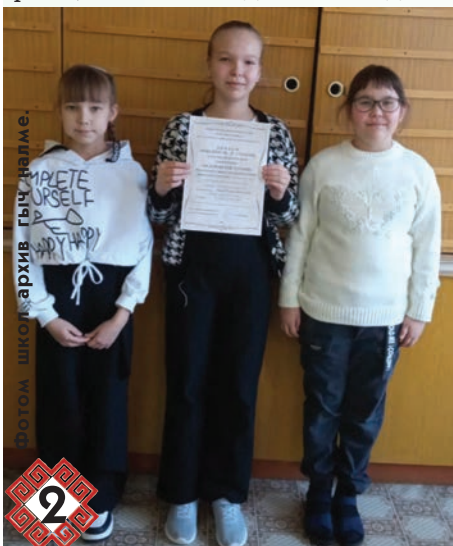
Фотом школ архив гыч калме.

Снимкыште: автор – Настя Яранцева да Алина Григорьева дене пырля.