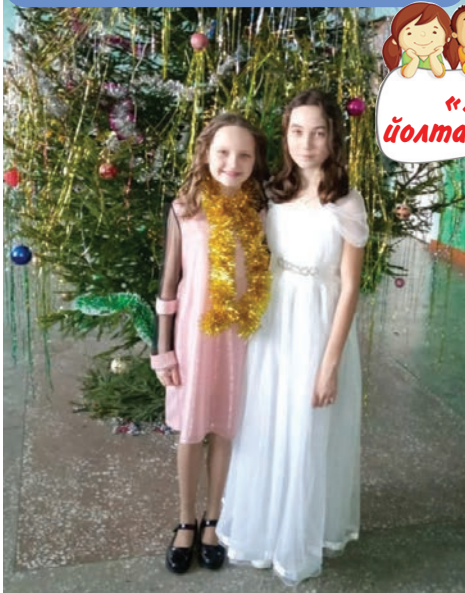
«Ушанле йолташем дене»