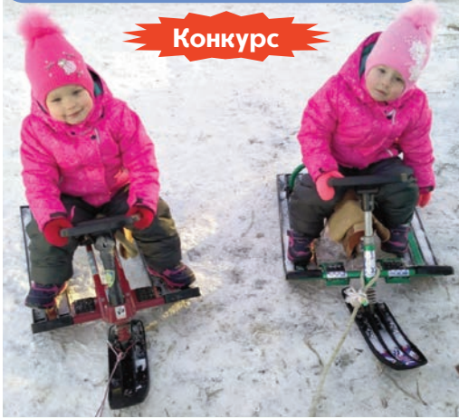
Ксения ден Камелия СТЕПАНОВАМЫТ.