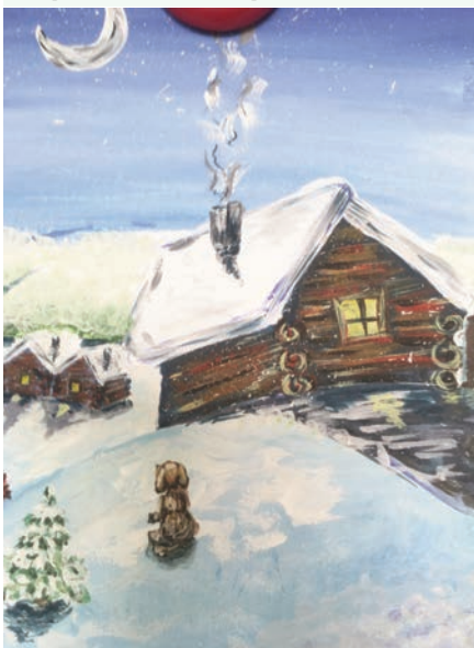
8 Валерия САИНАН сўретше. Морко, Коркатово.