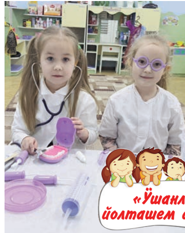
«Ўшанле йолташем дене»