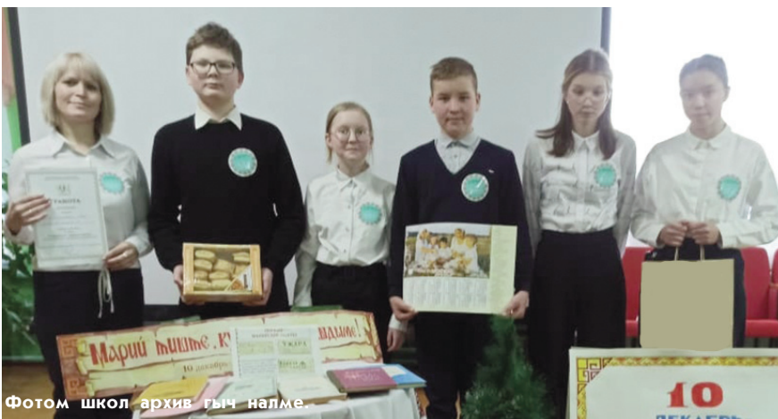
Фотом школ архив гыч налме.