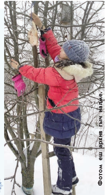
Фотом еш архив гыч налме.