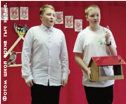
Фотом школ архив гыч налме.