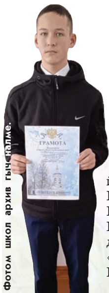
Фотом школ архив гыч налме.