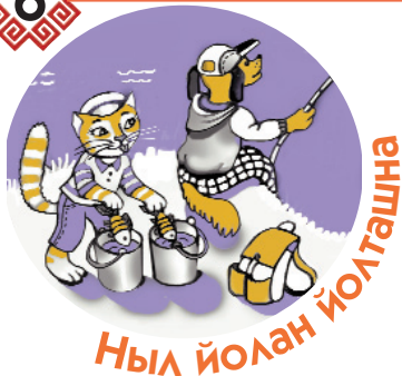
Ныл йолан йолташна

– Алёна Андреевна, сибирский хаскым, якут лайкым латик ий утла ончен куште-да. Нуно тыглай урлык деч мо дене ойыртемалтыт?