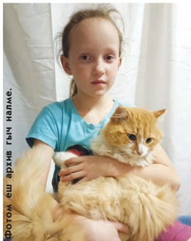
Фотом еш архив гыч налме.