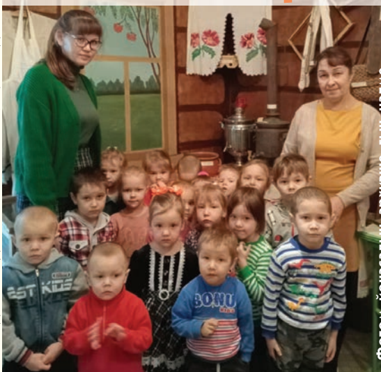
Фотом йочасадын архивше гыч галме.