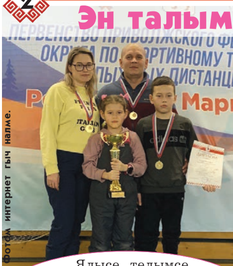
Фотом интернет гыч налме.

Ялысе тельмсе спорт модмашын финалже 16-20 мартыште Вологодск кундемысе Череповец олаште эртаралтеш.