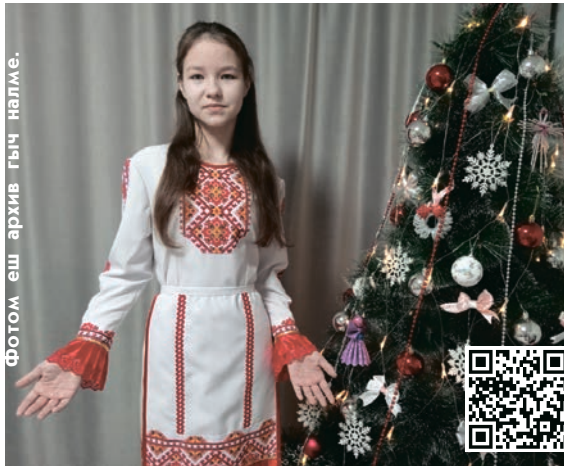
Фотом еш архив гыч нелме.