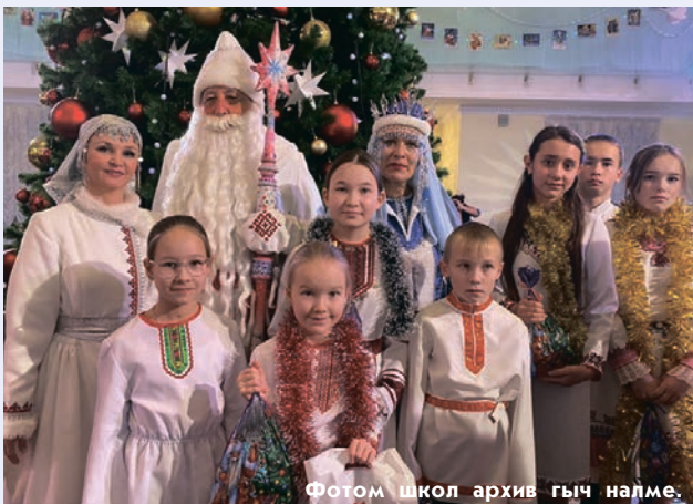
Фотом школ архив гыч налме.