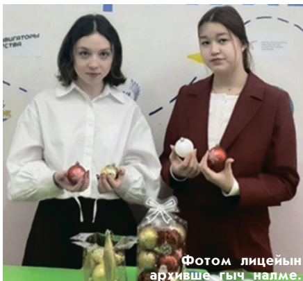
Фотом лицейын архивше гыч налме.