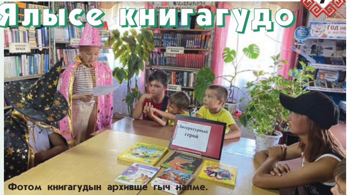
Фотом книгагудын архивше гыч налме.

Мый Ты-гыде Морко ялыште илем. Ялна кугу огыл гынат, книгагудо уло. Мый тушко кошташ йоратем. Библиотеке