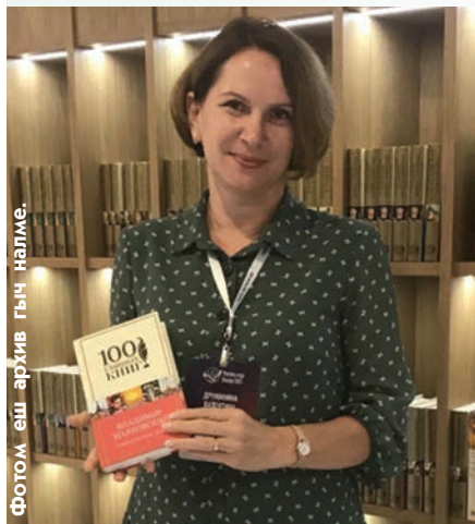
Фотом еш архив гыч налме.

– Кушкыл-влак шошо марте огыт коло. Клеткышт