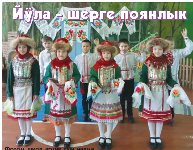
Фотом школ архив гыч налме.