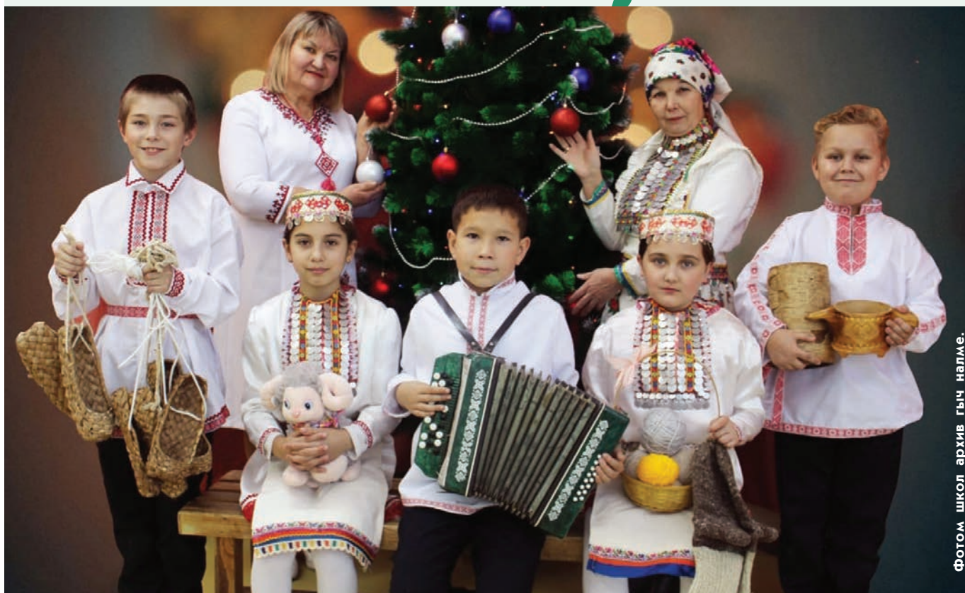
Фотом школ архив гыч налме.

Ш очмо кундемын эртыме корныжым радамлаш, кугезе йўлам аралаш, марий пайрем-влакым шымлаш кумылангыме шонымаш дене тўрлў конкурс ден проект эртаралтыт. Советский район Ургаш лицей Марий Эл Республикысе Образований да науко министерстве дене пырля «Пампалче деке унала» республикысе сетевой тунемме проектыш 1-4-ше класслаште тунемше-влакым ий еда уша. Эртыше ийын ты проект Шорыкйол пайремлан пўлеклалтын. Тўрлў район гыч 20 команде танасен. Йоча-шамыч коман-